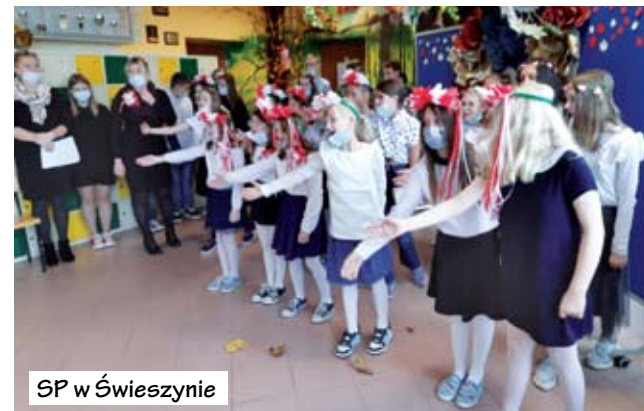
SP w Świeszynie

Podobnie jak dzieci ze Szkoły Podstawowej w Zegrzu Pomorskim, które zmontowały przedstawienie artystyczne w postaci multimedialnego przeglądu pieśni patriotycznych i wierszy.