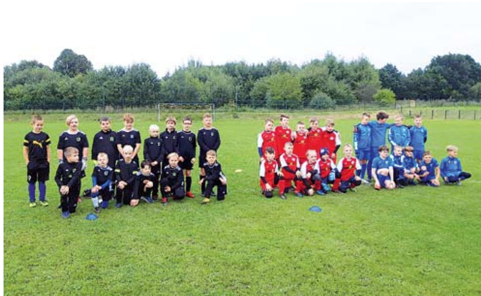
Na boisku w Kretominie