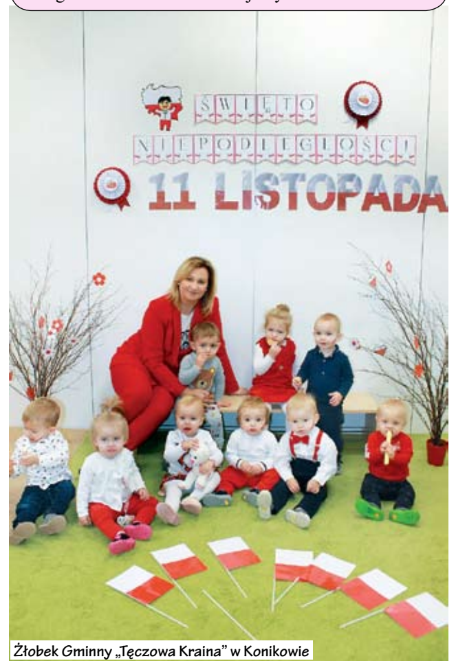
Żłobek Gminny „Tęczowa Kraina” w Konikowie

W Żłobku Gminnym "Tęczowa Kraina" w Konikowie „Dzień Niepodległości” również był świętowany. Z tej okazji, w każdej grupie odbyły się zajęcia oraz zabawy mające na celu kształtowanie