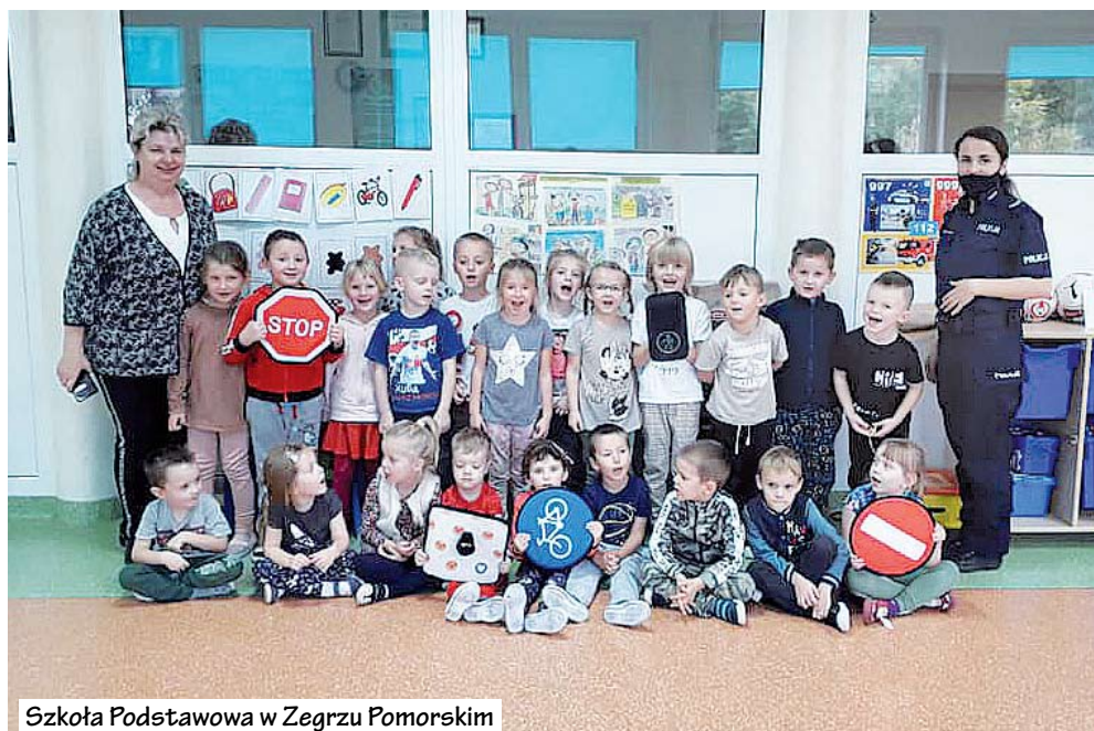
Szkoła Podstawowa w Zegrzu Pomorskim

Zajęcia miały na celu uświadomienie maluchom, jak ważne jest noszenie odbłasków, które pozwalają kierowcy zobaczyć pieszego nawet z dużej odległości. Podczas spotkania był czas na pamiątkowe zdjęcia, a także wręczenie paniom drobnych upominków przez dzieci ze starszej grupy.