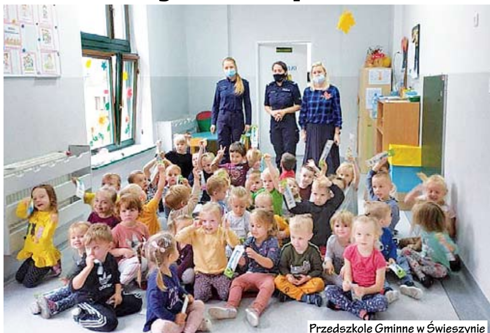
Przedszkole Gminne w Świeszynie

Policjantki z Wydziału Prewencji Komendy Miejskiej Policji w Koszalinie odwiedziły placówki oświatowe z terenu gminy Świeszyno.