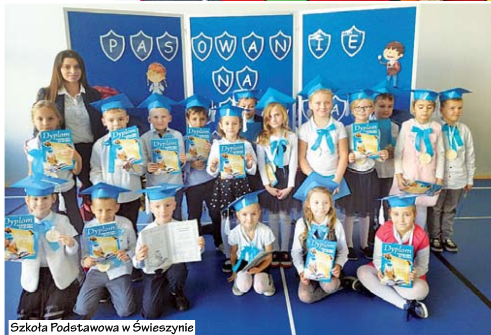
Szkoła Podstawowa w Świeszynie