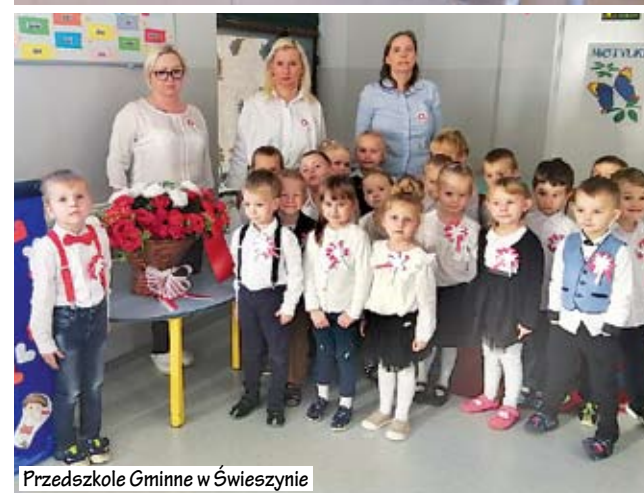
Przedszkole Gminne w Świeszynie

„Co to jest Niepodległość” - teraz wiem już na pewno. Każde dziecko dziś woła, to polski dom, polska szkoła...”