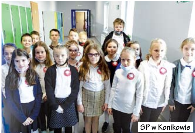
SP w Konikowie

W szkołach, gdzie propaguje się tradycje i wartości, a także symbole narodowe, w przeddzień Święta Niepodległości, odbyły się uroczystości upamiętniające to wydarzenie.