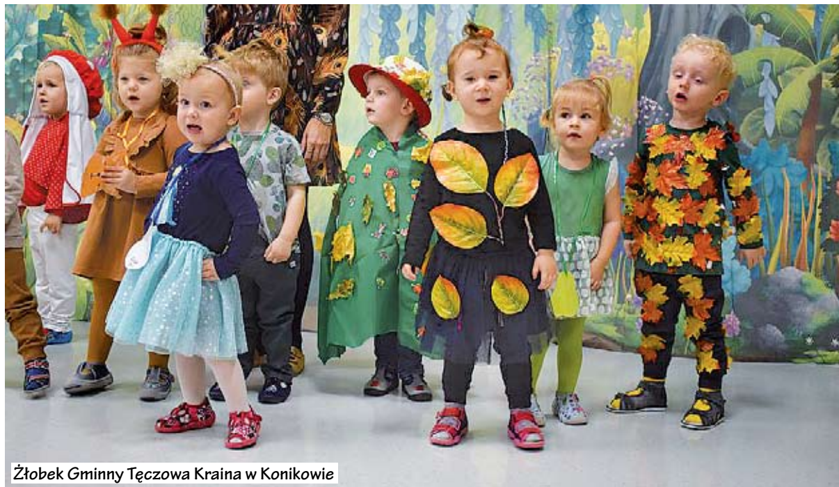
Żłóbek Gminny Tęczowa Kraina w Konikowie

To był bardzo ważny dzień w życiu najmłodszych mieszkańców gminy Świeszyno, którzy w tym roku przekroczyli progi Żłobka Gminnego Tęczowa Dolina w Konikowie, Przedszkola Gminnego w Świeszynie oraz świeszynskiej podstawówki.