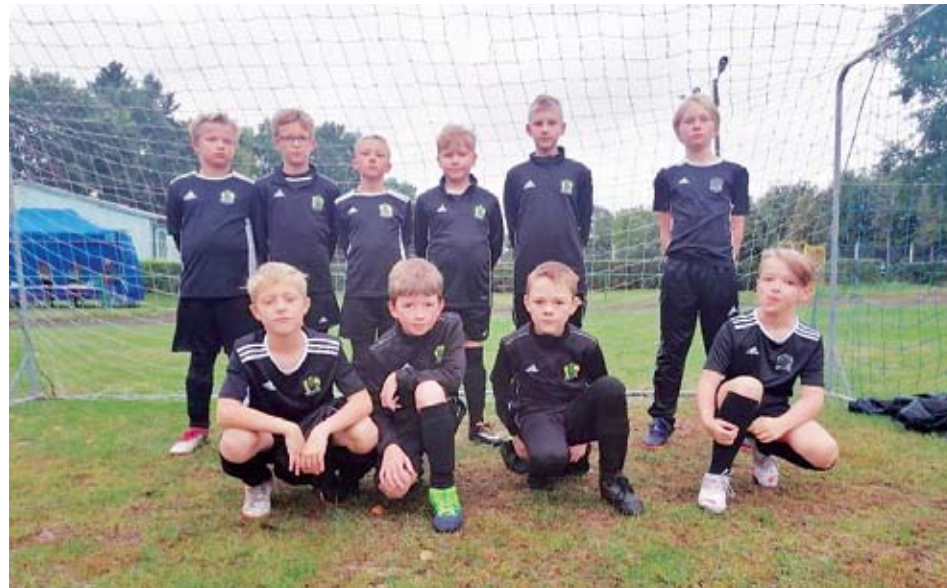
Pierwsza piłka w Tychowie