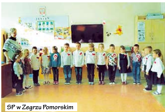
SP w Zegrzu Pomorskim