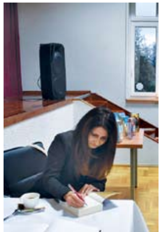
Dorota Milli ny”, „Tam, gdzie zavracają bociany”.

Jagiełło to autorka książek dla dzieci, młodzieży i dorosłych, wierszy i opowiadań, m.in. „Zielone martensy”, „Urodzi-