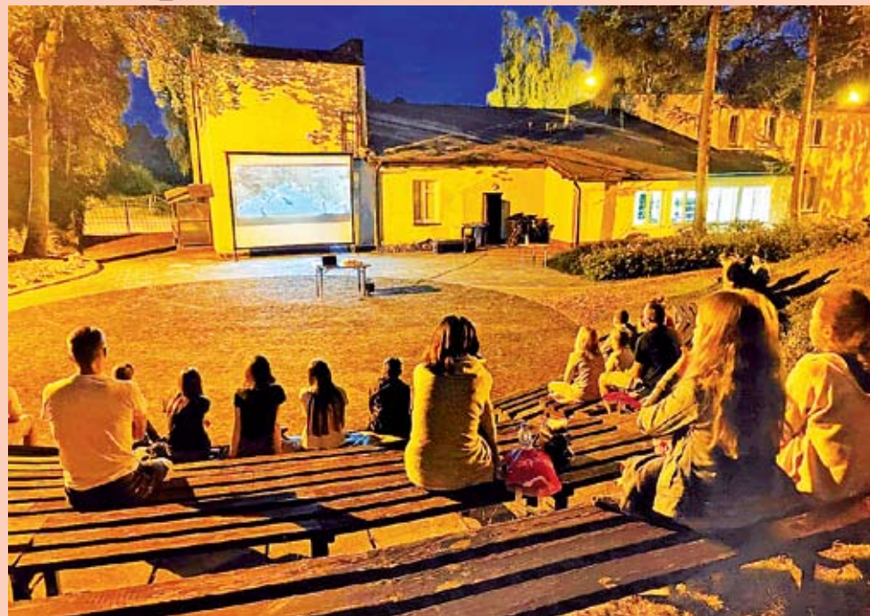
Letnie Kino Plenerowe

technikami, zorganizowany został plener malarski a także zrobili własną Fotobudkę. Ogromną radość sprawiła dzieciom nasza niespodzianka czyli „Wielka balonowa bitwa wodna”.