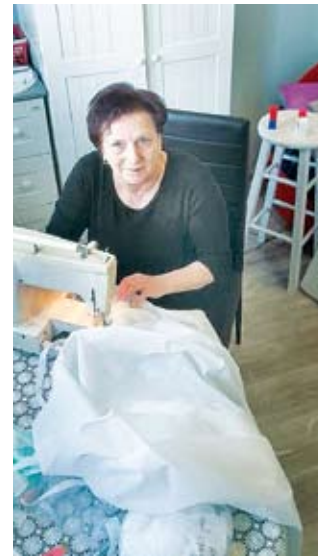
KGW Marysieńki ze Świeszyna

dująca jest bezinteresowna gotowość do poświęceń, umiejętność jednoczenia się w ciężkich chwilach i wykazywanie prawdziwie obywatelskiej postawy. Pięknie dziękujemy wszystkim, którzy przyłączyli się do akcji!