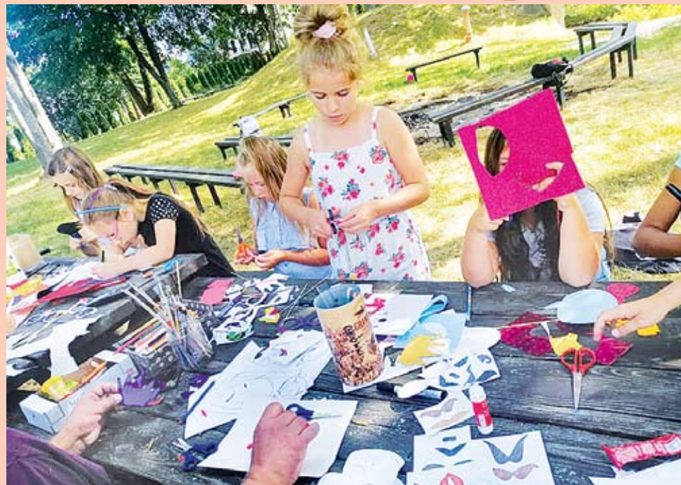
Letnie Plenerowe Warsztaty Wiele działo się w Multimedialnym Centrum Kultury e-Eureka - Biblioteka Publiczna w Świeszynie.