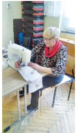
KGW Radwianki z Niedalina