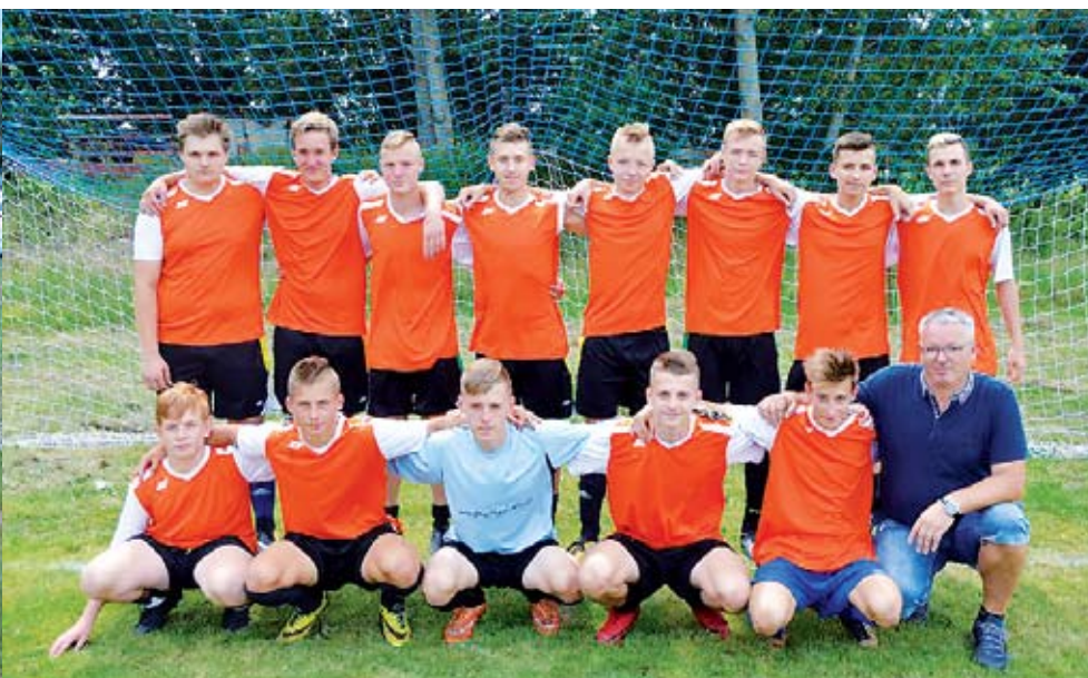
W turnieju między innymi udział wzięli juniorzy Wichra Mierzym

W turnieju wzięły udział cztery drużyny: Wicher Mierzym, KS Hajka Zegrze Pomorskie, Grot Bonin oraz drużyna Wicher Mierzym Juniorzy. Rywalizacja była bardzo wyrównana i przebiegała w przyjaznej atmosferze,