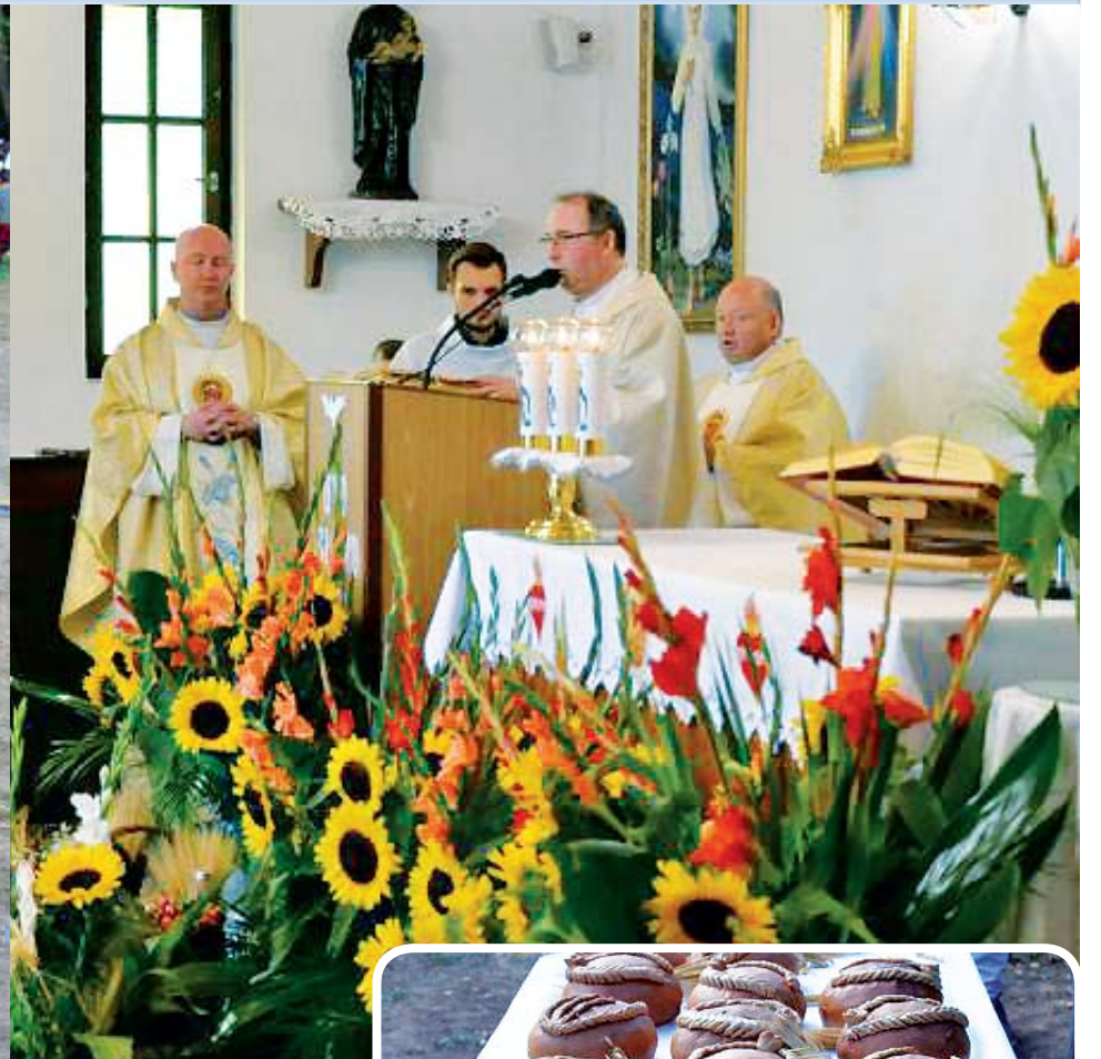
Dożynkową mszę celebrowało trzech księży z terenu gminy Świeszyno

Dożynki to zwieńczenie trudu i ciężkiej pracy rolników.