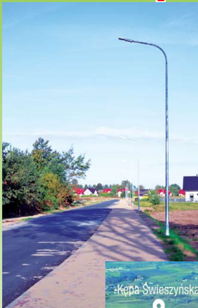
Droga Niekłonice - Konikowo

Rok 2017. Jedną z ważniejszych inwestycji podnoszących jakość życia mieszkańców gminy Świeszyno była budowa sieci wodociągowej łączącej Kępę Świeszynską - Olszak - Brzeźniki. W ramach inwestycji wybudowano sieć wodociągową o długości 1457 mb wraz z przyłączami do nieruchomości.