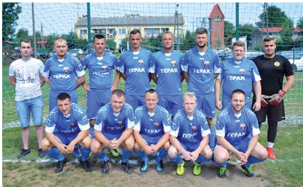
Turniej wygrał zespół Grot Bonin

Zawodnicy Grot Bonin zwyciężyli w turnieju imienia Herberta Lubke, rozegranego na boisku w Mierzymiu.