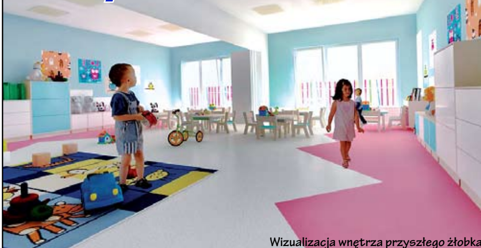
Wizualizacja wnętrza przyszłego żłobka

Po uroczystym podpisaniu umowy na budowę żłobka w Konikowie, nadszedł czas na rozpoczęcie prac w terenie. Na realizację inwestycji Gmina otrzymała dofinansowanie w ramach resortowego programu rozwoju instytucji opieki nad dziećmi w wieku do lat 3 „Maluch+” w wysokości 640 000,00 zł.