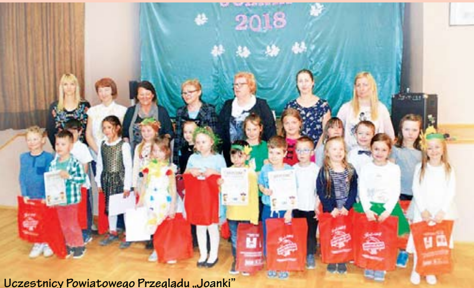
Uczestnicy Powiatowego Przeglądu „Joanki”

Sukcesy odnieśli przedszkolaki z Przedszkola Gminnego w Świeszynie w konkursach recytatorskim i plastycznym.