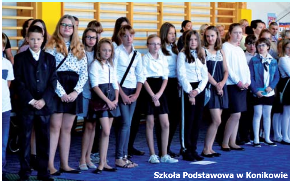
Szkoła Podstawowa w Konikowie