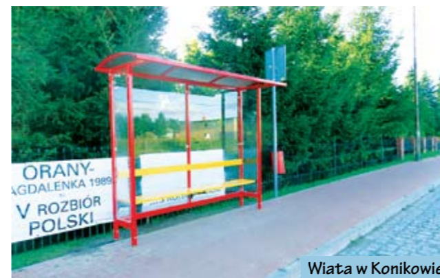
Wiatka w Konikowie

Wakacje to czas realizacji inwestycji na terenie gminy Świeszyno.