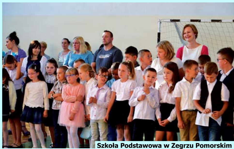
Szkoła Podstawowa w Zegrzu Pomorskim