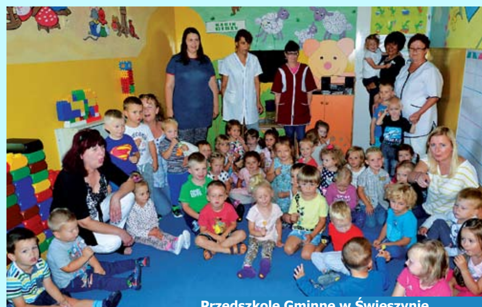
Przedszkole Gminne w Świeszynie

W Gimnazjum im. 27 WDP AK w Świeszynie naukę rozpoczęło 124 uczniów (6 klas) W okresie wakacji wykonano remont sanitariatów uczniowskich oraz sanitariat dla per-