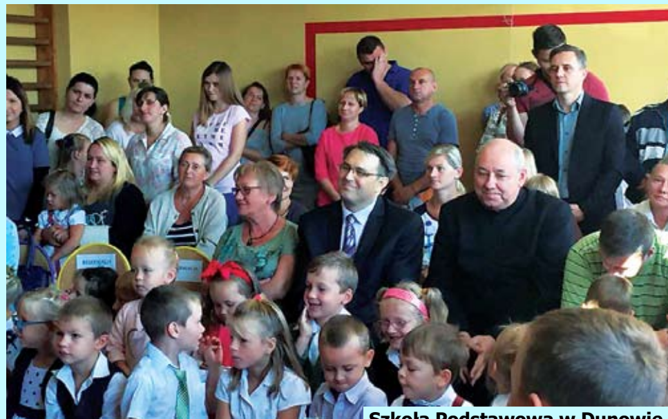
Szkoła Podstawowa w Dunowie