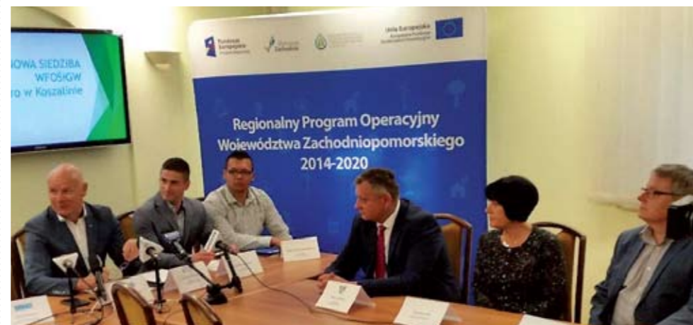
Uczestnicy podpisywania umowy na zakup wozu dla OSP

Już w najbliższym czasie, OSP z Niedalino wzbogaci się o nowy wóz strażacki.