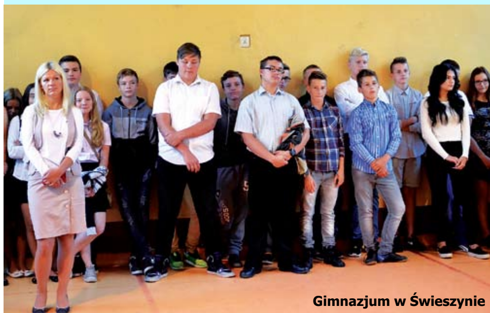
Gimnazjum w Świeszynie