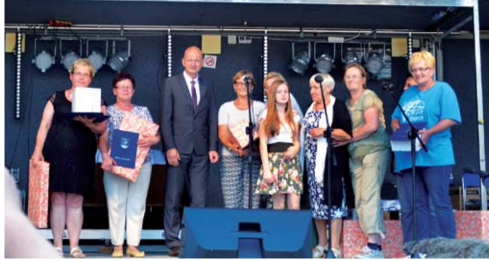
Laureaci konkursu powiatowego na potrawy z ziemniaka