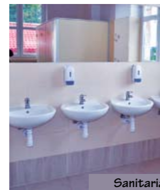
Sanitariaty w Gimnazjum w Świeszynie

Jedną z nich jest montaż 12 wiat przystankowych. Powstaną one w Konikowie (aż 4), Strzeżęcino, Bardzlinie, Jarzycach, Giezkowie, Nieklonicach (2), Chłopskiej Kępie i Dunowie. W Konikowie wiaty zostały już zamontowane. Wartość inwestycji to 46.118,85zł. Ma być zakończona do końca września.