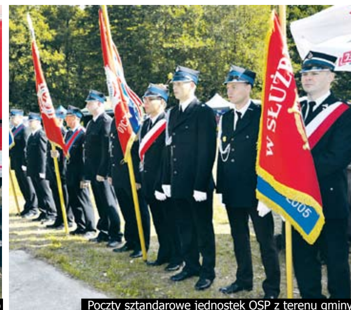
Początek sztandarowe jednostek OSP z terenu gminy

sem. Wspólne świętowanie, biesiada, przepelnione były przyjazną atmosferą.