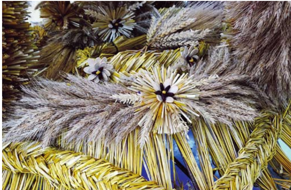
Misternie wyplecione elementy wieńca