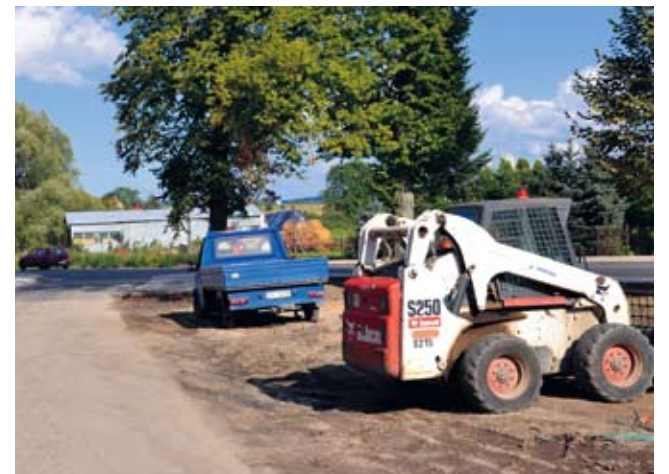
Dobiega końca realizacja kilku inwestycji ważnych dla gminy Świeszyno.

Już został zakończony I etap budowy sieci wodociągowej pomiędzy miejscowościami Konikowo i Niekłonicze wraz z wykonaniem przewiertu pod torami kolejowymi. Trwają jeszcze prace wzdłuż drogi powiatowej w Niekłonicach. Inwestycja, której koszt wynosi 344 400,00 zł finansowana jest w całości z budżetu gminy.