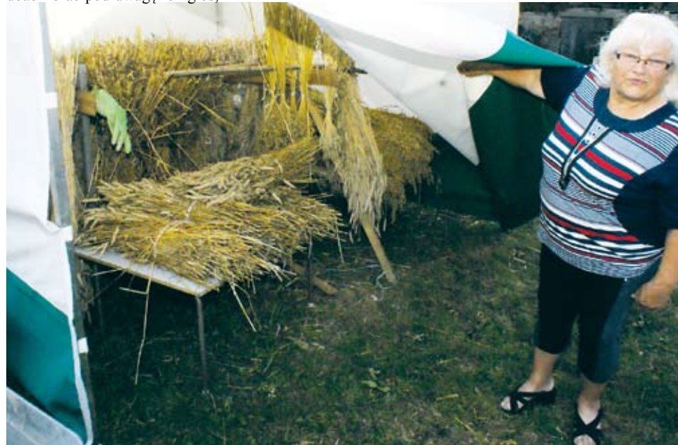
Zboża na wieniec są starannie selekcionowane, czyszczone, suszone i magazynowane