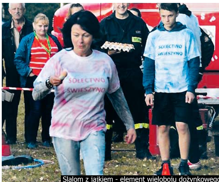
Ślalom z jajkiem - element wieloboju dożynkowego