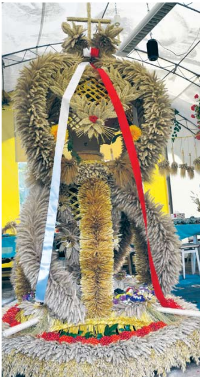
Niekłoniczki wieńiec na Dożynki Prezydenckie 2015