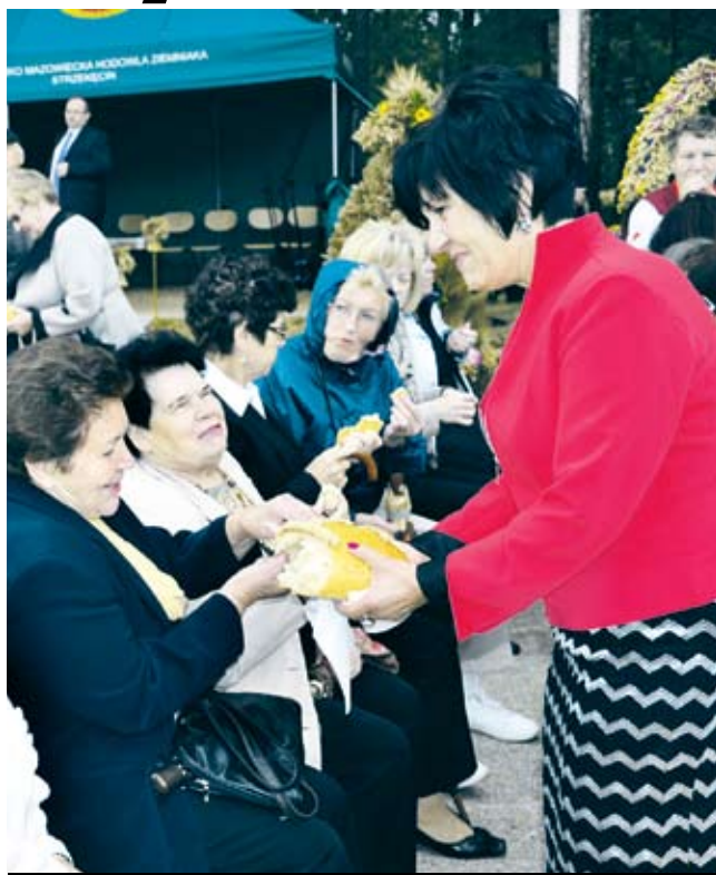
Zgodnie z tradycją, Wójt Gminy podzieliła się chlebem z mieszkańcami

Wójt gminy zadbała, by podczas biesiady dożynkowej wszyscy mieszkańcy mogli częstować się wyrobami wędliniarskimi, domowym smalcem, pysznym gulaszem z żołądków, flaczkami, bigo-