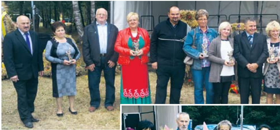
Powyżej: nagrodzeni statuetkami za wkład w rozwój rolnictwa