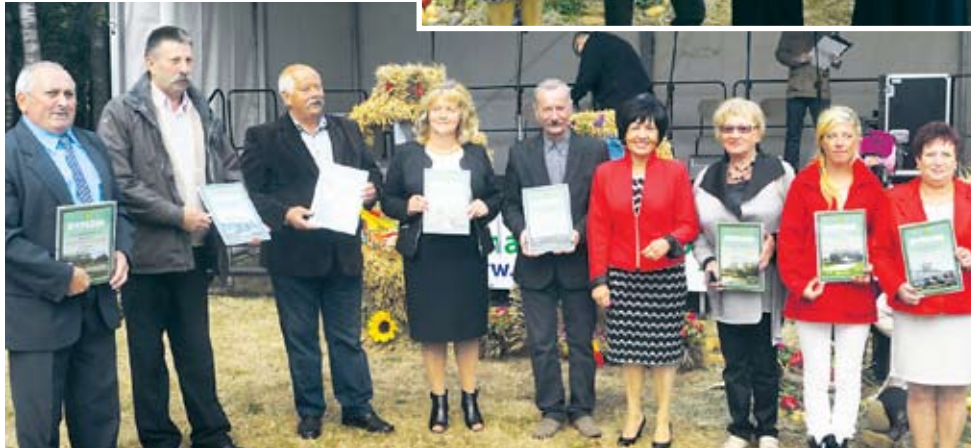
Poniżej: przedstawiciele sołectw biorących udział w konkursie pn. Nasze czyste sołectwo