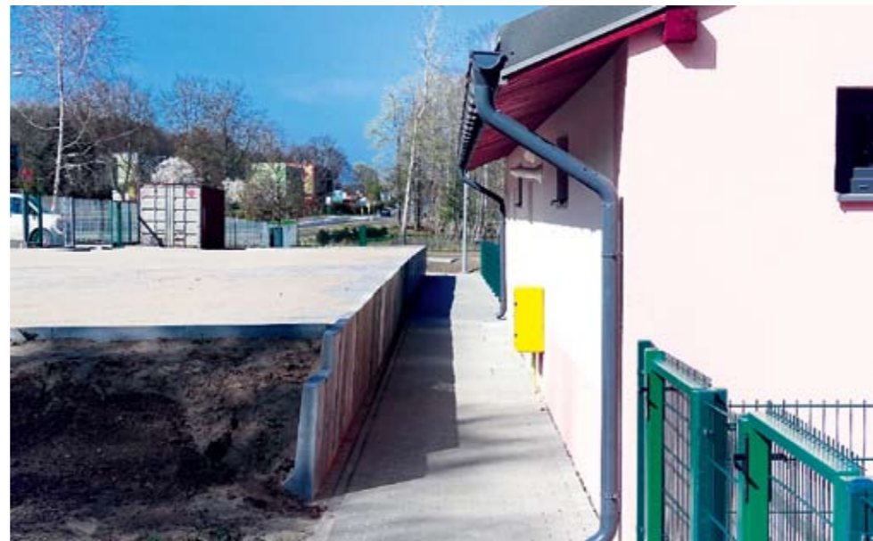
Mur oporowy bez barierki stwarza niebezpieczeństwo wypadku

Nikt nie pomyślał, że do utrzymania w odpowiednim stanie boiska potrzebne jest jego odwodnienie, ale także od-