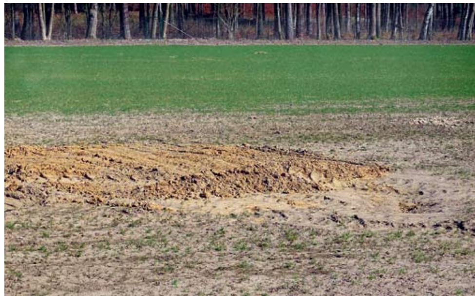
Piaszczysta „plaża” zamiast zielonej murawy

Niezabezpieczona skarpa, krzywe, piaszczyste klepisko, na którym nie chce rosnąć trawa, odwodnienie może i zgodne z projektem, ale nie ze zdrowym rozsądkiem. Do tego brak doprowadzenia wody rurami o odpowiednim przekroju i wiele innych mankamentów – tak przedstawia się obraz boiska sportowego w Strzekęciniu.