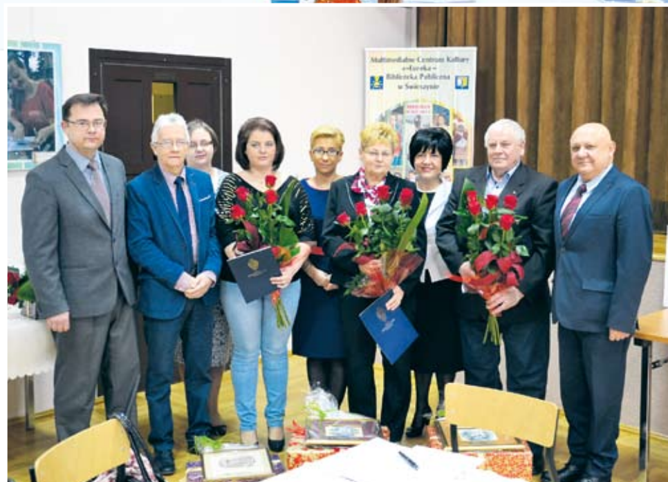
Podczas sesji Rady Gminy Świeszyno pożegnano sołtysów mijającej kadencji